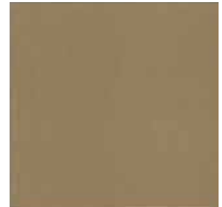
TD A983 - Dourado